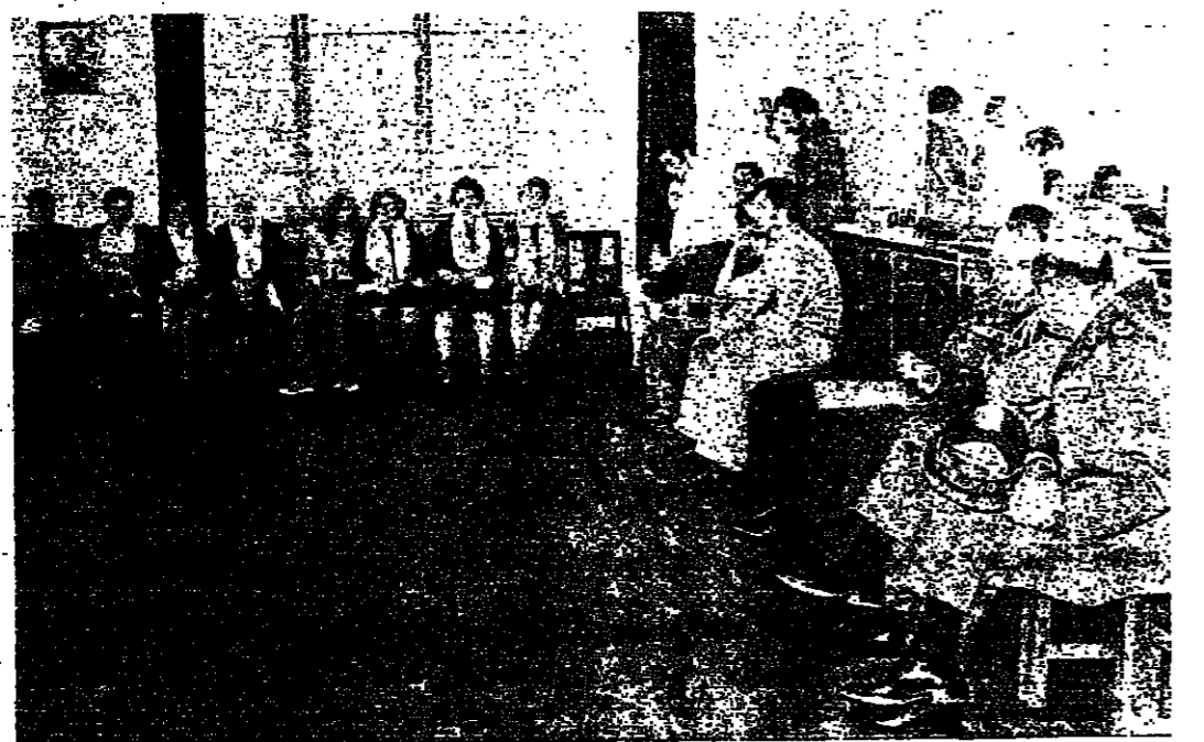
عدد من كبار الضباط وعائلات الشهداء في النادي العسكري ببيروت امس

كتب نزيه نقوزي : استشهد ٤ ضباط لبنانيين ، و ١٤ من الجنود ، وجرح ٤٢ آخرون ، في الاعتداءات الاسرائيلية على ثكنة صور ومخيمات البص والبرغلية وبرج رحال امس . وقد دبرت تقابل العدو ، من البر والبحر والجو ، عشرات المساريل والاكواخ في مخيم البرغلية .. وعلى كل اعتداء كان الرد عنيفاً ، من قسبل الجيش والقوية ، وكبهد العدو خسائر في الارواح . والاعتداءات حصلت على مرحلتين ، الاولى بدأت في الواحدة والنقبة . ٥ نجر امس ، عندما تسفلت قسوة « كورندوس » للعدو ، قدرت بـ ٢٠٠ جندي الى شاطي البص ، وانخذت من مركز مصلحة كورباده لبنان عد . مدخل المخيم الغربي مركزاً لنا . تمركز .. وقصفوا